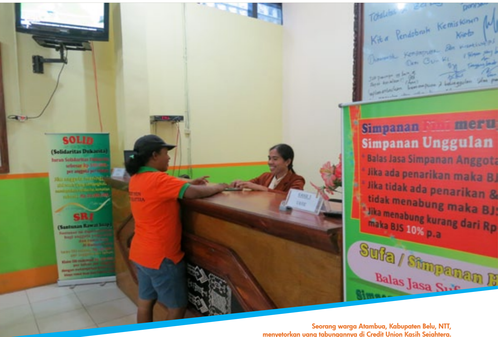
Seorang warga Atambua, Kabupaten Belu, NTT, menyetorkan uang tabungannya di Credit Union Kasih Sejahtera.