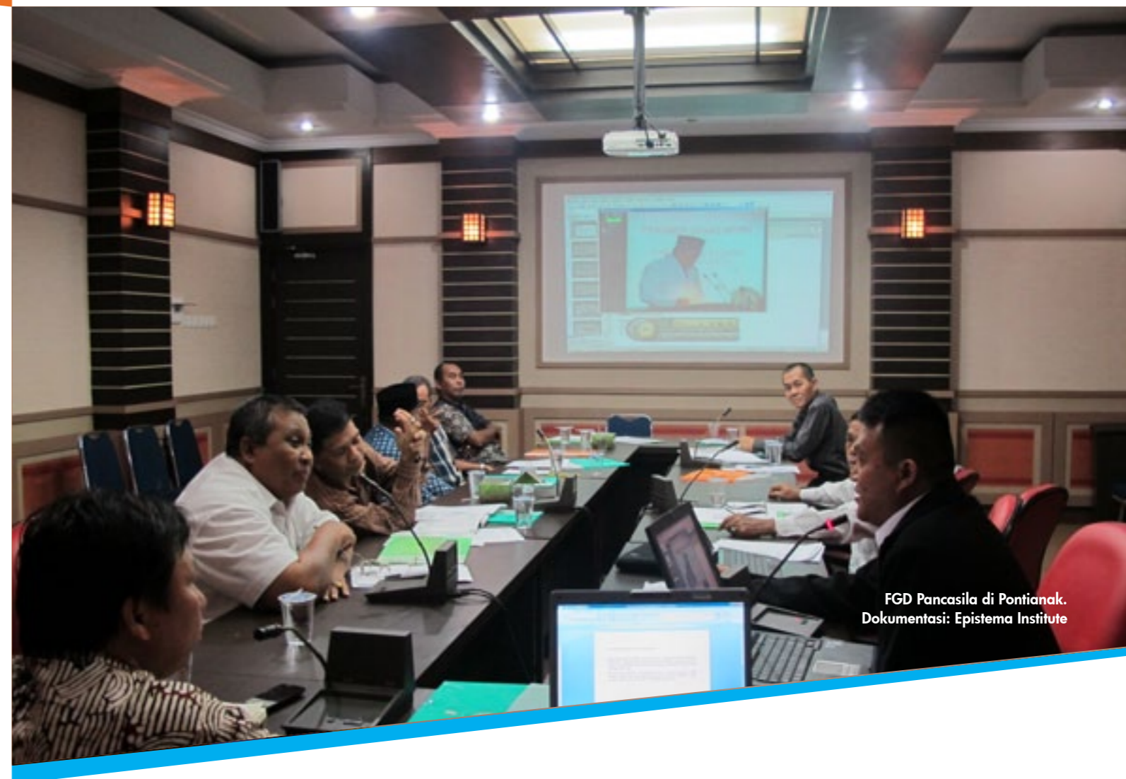
FGD Pancasila di Pontianak.

Epistema Institute menggelar Seri Lokakarya Pancasila, Pendidikan Karakter dan Pendidikan Tinggi Hukum bersama-sama dengan Kementerian Pendidikan dan Kebudayaan, khususnya dengan staf khusus Menteri bidang evaluasi pendidikan yang mempunyai program pengkajian pelaksanaan pendidikan karakter. Selama ini, hal yang dirasakan adalah miskinnya pendidikan karakter yang terinternalisasi dalam pengajaran di fakultas-fakultas hukum. Tantangannya adalah menjadikan nilai-nilai Pancasila, khususnya toleransi dan demokrasi substantif, agar dapat dijadikan acuan.