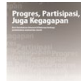
Tempo Institute Riset KIP