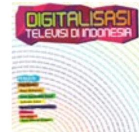
PR2 Media Digitalisasi TV