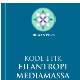
Kode Etik Filantropi Media Massa