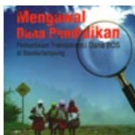
KOAK Mengawal Dana Pendidikan