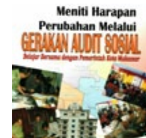
YKPM Meniti Harapan Perubahan Melalui Gerakan Audit Sosial