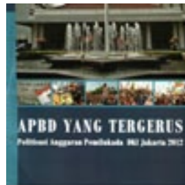
IBC APBD yang Tergerus