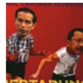
AJI Jakarta Reportase Jurnal Laporan Investigasi