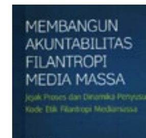
PIRAC Membangun Akuntabilitas Filantropi Media Massa