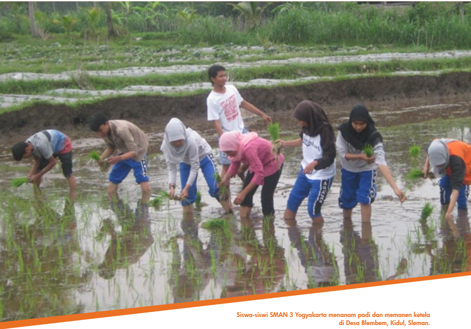
Siswa-siswi SMAN 3 Yogyakarta menanam padi dan memanen ketela di Desa Blembem, Kidul, Sleman.