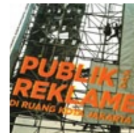
ruangrupa Publik dan Reklame di Ruang Kota Jakarta