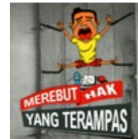
Malang Corruption Watch Merebut Hak yang Terampas