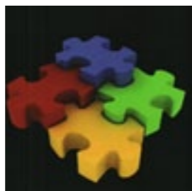
IMPARSIAL Dilema Pengaturan Keamanan Nasional