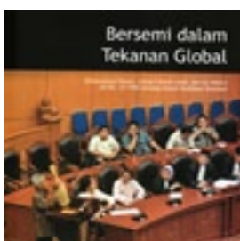
FIELD Bersemi Dalam Tekanan Global