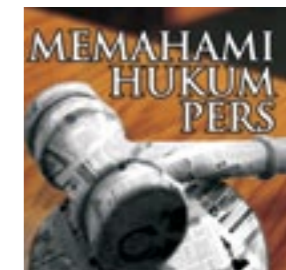
Memahami Hukum PERS