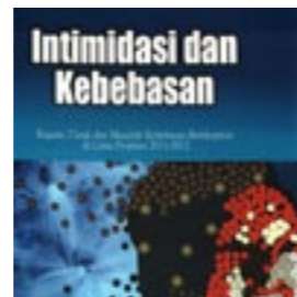
ELSAM Intimidasi & Kebebasan