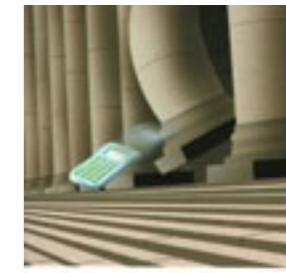
Perludem Mahkamah Konstitusi Bukan Mahkamah Kalkulator