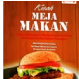
CEES Kisah Meja Makan