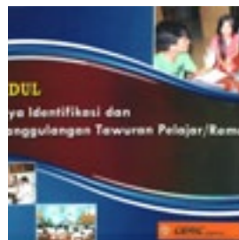
CERIC Upaya Identifikasi & Penanggulangan Tawuran Pelajar Atau Remaja