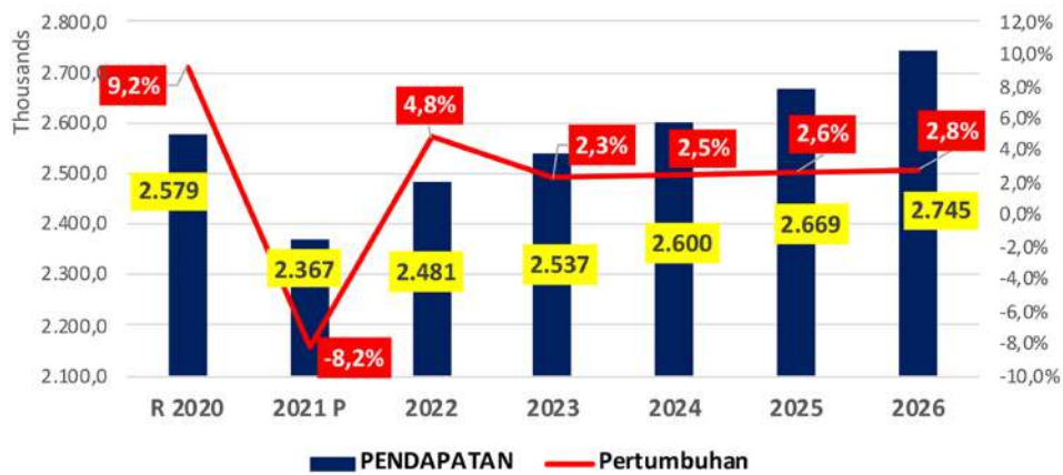
PERTUMBUHAN PROYEKSI PENDAPATAN RPJMD 2021-2026 KABUPATEN TUBAN

Ditengah situasi darurat Kesehatan yang berdampak tidak hanya pada sector Kesehatan tetapi juga berdampak pada social dan ekonomi, dan juga berakibat pada ketidakstabilan keuangan negara karena pendapatan negara yang turun naik pada masa pandemic, maka kerangka pendanaan/proyeksi keuangan daerah masa yang akan datang yang baik adalah APBD yang proyeksinya realistis dengan demikian kredibilitas anggaran tetap terjaga.